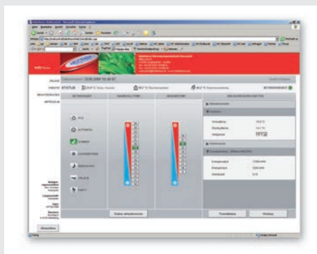
Benutzeroberfläche web control®